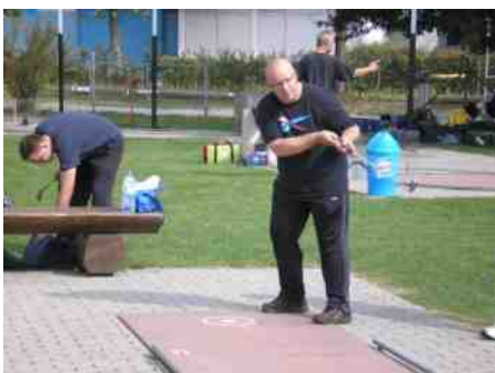
Eppie in actie