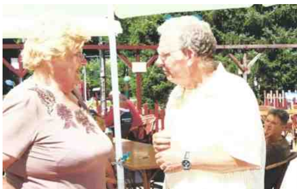
Toenmalige NOC*NSF voorzitter Erica Teprstra bezocht in 2009 het NK Combi in Appelscha en is hier ingesprek met toenmalig NMB--voorzitter Douwe van der Zee

Op 4 en 5 juli kreeg Appelscha de Nederlandse top weer op de baan voor het Combi kampioenschap van 2009. Voor dit NK moeten de deelnemers zowel op de korte baan als op de filtbaan 4 ronden spelen en dat gebeurt nu om en om. Dus na een ronde kort volgt een ronde filt. Op de eerste dag van dit NK kwam de toenmalige NOC*NSF voorzitter Erica Terpstra naar Appelscha om een kijkje te nemen bij een NK van een van de kleinere sportbonden bij het NOC*NSF, Met veel belangstelling en interesse is Erica Terpstra toen een paar uur bij dit kampioenschap geweest. Dit combi kampioenschap werd beslist met een match play finale en hierbij werd bij de dames senioren Antje Hof kampioen en bij de jongens scholieren was de titel voor Jan Egbert Hooijsma.