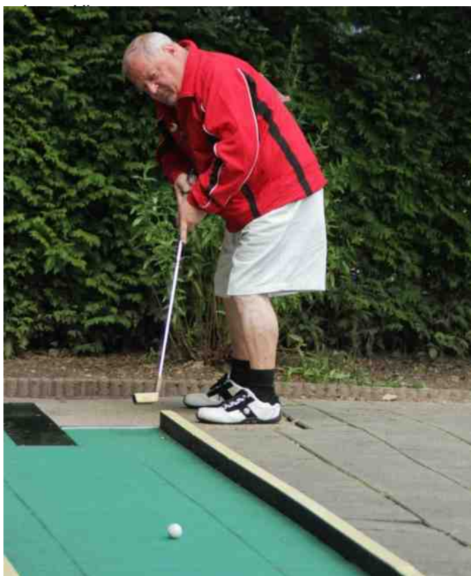
Één van de Oostenrijkse heren in actie in 2013.