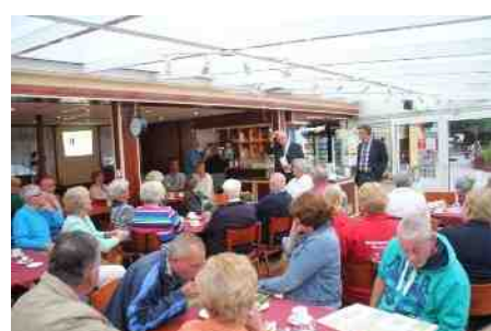
Veel belangstelling voor plakboeken uit het verleden.