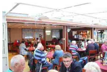
Overzicht van de aanwezigen.